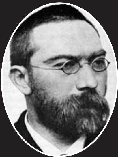
Per Sivle (1857–1904)

Kvar vart det taa alle dei fuglar, som song i Sumar so vænt millom Greino? Sidan eg høyrde deim ender og Gong; og so vart det Stilla i eino – Han tagnar, Fuglen, mot hausten