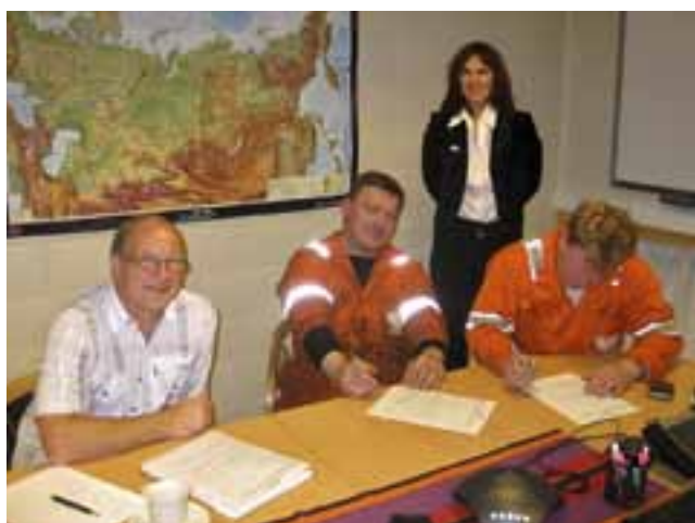
I tillegg utfører vi på SUA Skatt i Kirkenes andre skattekontorets -og folkeregisteretsoppgaver.

I tillegg er vi på kontroll i lag med Arbeidstilsynet hos arbeidsgivere som har utenlandske arbeidstakere.