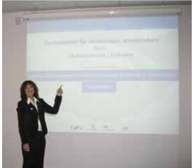
Møtet var en suksess og vi fikk mange positive tilbakemeldinger.

Vårt mål er å behandle sakene våre så rask som mulig: