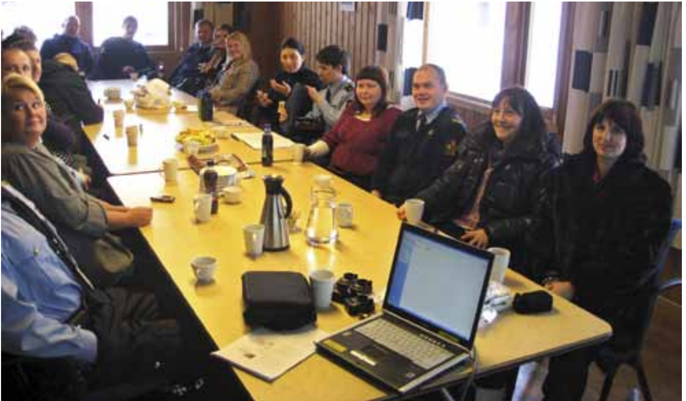
I forbindelse med ID-kontroll deltok vi på møte på Norsk grensestasjon Storskog.