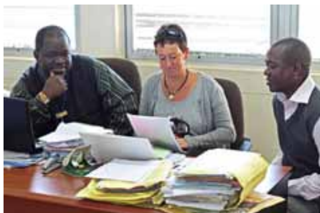
Bokettersyn sammen med skatterevisorer på Large Taxpayers office.

Zambia har vært en selvstendig republikk siden 1964 og er tidligere Nord Rhodesia. De har engelsk som offisielt språk og landet har ca 14 millioner innbyggere. Det