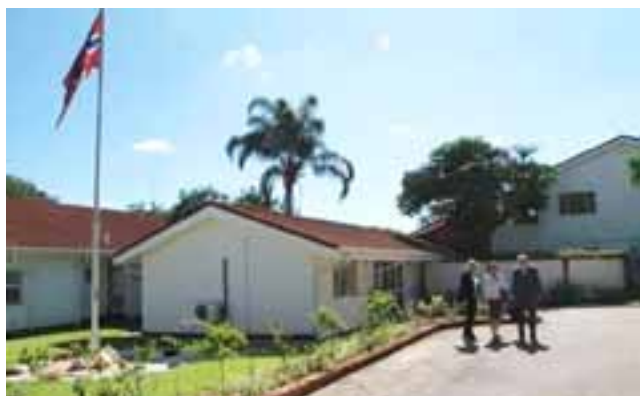
Utenfor ambassaden i Lusaka.

Det er en vennlig og høflig atmosfære mellom de som