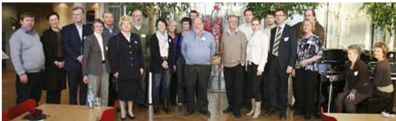
Noen av nemndsmedlemmene samlet i 2009 (foto: Fredrik Ravn).

! Det er en fornuftig arbeidsmetode, og det er mitt beste inntrykk at så skjer i Skatt øst. De aller fleste klagen blir avgjort av skattekontoret før saken blir forelagt skatteklagenemnda. Det er ressurskrevende både for skattyter og for skattekontoret å fremme saker for skatteklagenemnda.