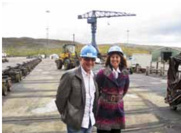
Her er vi på kontroll på skipsverft «KIMEK».