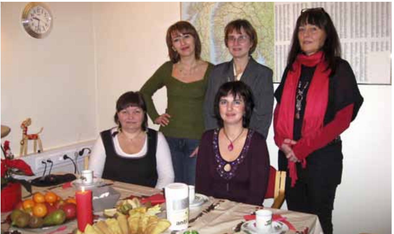
Først var vi på besøk hos dem og etterpå var det vår tur å ha dem på julebesøk.