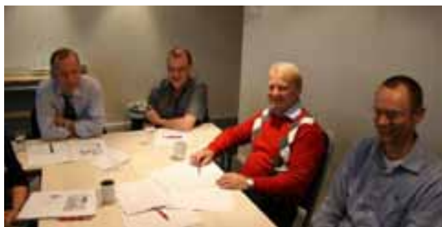
Flere aktive deltagere.

Honoraret ble også påpekt da dette har stått uforandret siden oppstarten av skatteklagenemndene. Det bør også settes på dagsorden om hvorvidt honoreringen kan innrettes på en annen måte. Dette blant annet fordi det kan gi grunnlag for større interesse og ønske om å gå dypere inn i saker der det er tvil og det kan bli dissens.