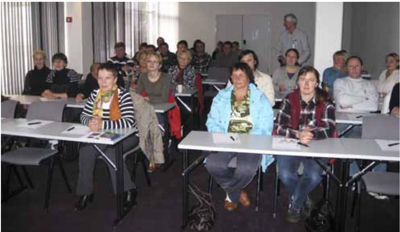
For å gi utenlandske arbeidstakere enda mere informasjon om norske skatteregler arrangerte vi møte for russisktalende arbeidere i fjor.