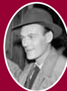
Agnar Mykle (1915–1994) – forfatter

Er det ikke ordene som skiller oss fra hverandre? Er det ikke ordene som er menneskehetens forbannelse?