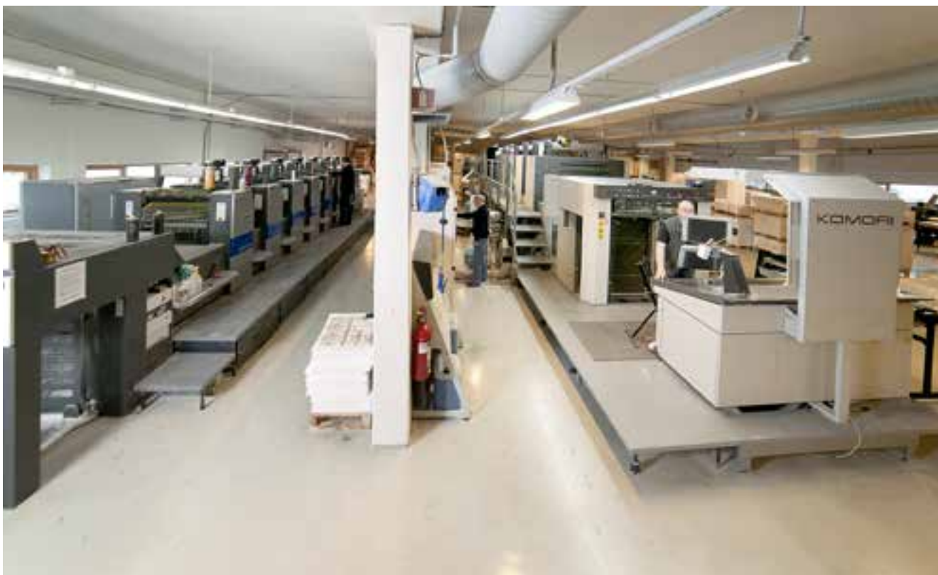
Glimt fra tykkeriet

Når dette arbeidet er unnagjort, er det stort sett Bodoni som står for resten av produksjonen av det endelige heftet. Dette innebærer å legge det ut på nettet, noe som vanligvis skjer flere uker før det fysiske heftet er blitt trykket og utsendt pr. post. Da hele produksjonsprosessen av et Utv-hefte vanligvis tar ca. 8 uker fra oppstartsdato til endelig postutsendelse, bør den som søker etter en relativt fersk domsavgjørelse først prøve et søk i nett-utgaven av Utv.