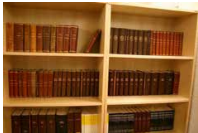
Mye skattesusk som er avdekket er lagret i Ligningsutvalgets hyller. Enkelte ble også frikjent.