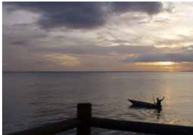
Man kan ikke klage på utsikten...

mange både interessante og lærerike diskusjoner. Programmene har en god del overlappende interesser, så det er viktig å vite om hverandre og hva som skjer også utenfor egen «boble».