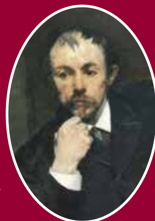
Arne Garborg (1851–1924) norsk dikter

Ung kan ikkje lære av gamal, kunne han det, vart han gamal sjøl og våga seg ikkje på livet.