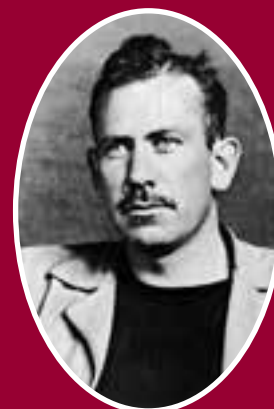
John Steinbeck (1902–1968) amerikansk forfatter

Det er merkelig, men sant. Når en forfatter mister pusten, blir setningene ikke kortere, men lengre.