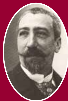
Anatole France (1844–1924)

Lån aldri bort bøker, for ingen leverer dem tilbake. De eneste bøkene jeg har i mitt bibliotek, er bøker andre har lånt meg.